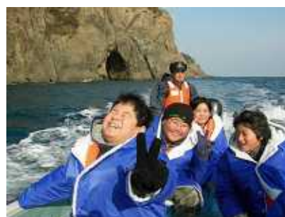
サッパ船(小型漁船)体験