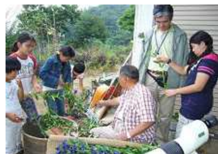
りんどう収穫体験