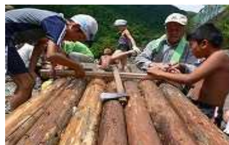
間伐材いかだ作り