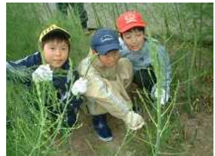
アスパラ収穫体験