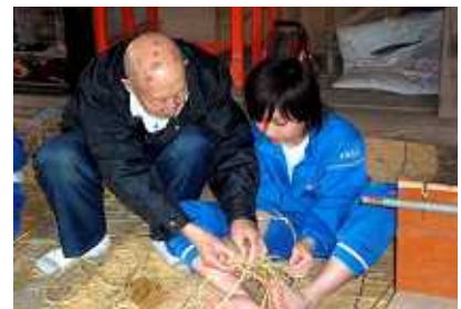
わら細工体験（わらじ作り）