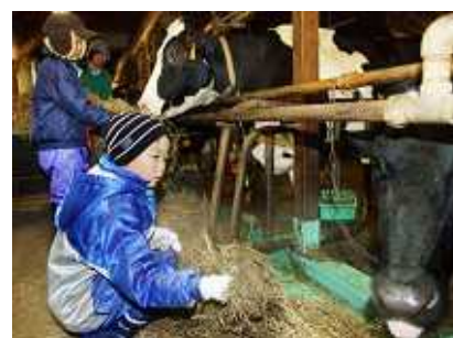
育成牛の飼育管理体験