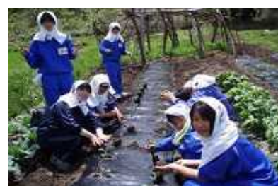
てぬぐいをかぶって農作業体験