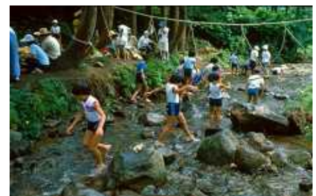
自然散策・川体験