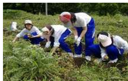
ホームステイ先での農業体験