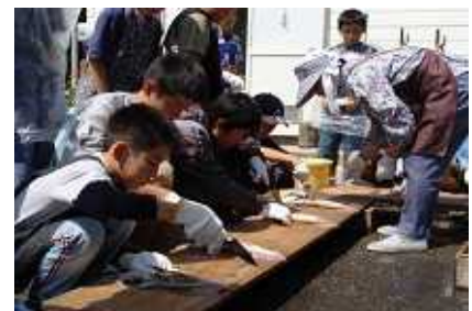
イカ一晩干し作り