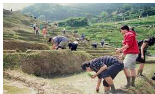
千枚田（輪島：田植え）