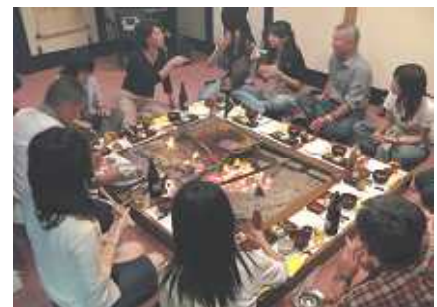
農家民宿でのだんらんのひととき