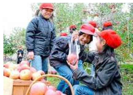
りんごづくり体験